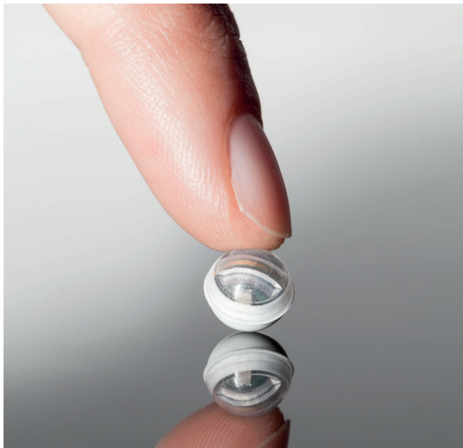
Messkugel aus dem Projekt Sens-o-Spheres

Das Fraunhofer-Institut für Elektronische Nanosysteme ENAS ist der Spezialist und Entwicklungspartner im Bereich Smart Systems und deren Integration für unterschiedlichste Anwendungen. Auf die Herausforderung Mikro- und Nanosensoren sowie -aktoren und Elektronikkomponenten mit Schnittstellen zur Kommunikation und einer autarken Energieversorgung zu Smart Systems zu verknüpfen hat sich Fraunhofer ENAS spezialisiert und unterstützt damit das Zukunftsthema Internet der Dinge. Das Institut entwickelt für und mit seinen Kunden Einzelkomponenten, die entsprechenden Technologien für deren Fertigung, Systemkonzepte und Systemintegrationstechnologien und unterstützt aktiv den Technologietransfer. Es bietet Innovationsberatung, begleitet Kundenprojekte von der Idee über den Entwurf, die Technologieentwicklung oder die Umsetzung anhand bestehender Technologien bis zum getesteten Prototypen.